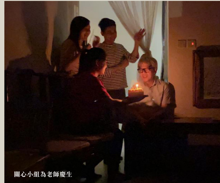
關心小組為老師慶生