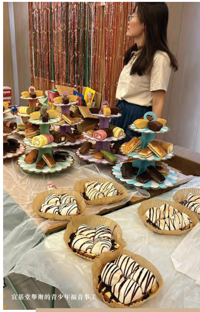
宣基堂舉辦的青少年福音事工

但逆境也是生命更新的契機。只要核心信念不變，逆境便成為轉化的動力。宣基堂堅持傳福音領人歸主是他們的核心價值，是教會的核心使命。「開荒、吃苦、火熱」就是這幾位校友的核心信念。幾百個青年人有一半移民了，過去兩年他們就重新上路，努力去向下一代的青少年傳福音，又招聚了全新的一、二百個中學生回來，幾位校友亦正努力帶領他們信主和做門徒訓練的工作。