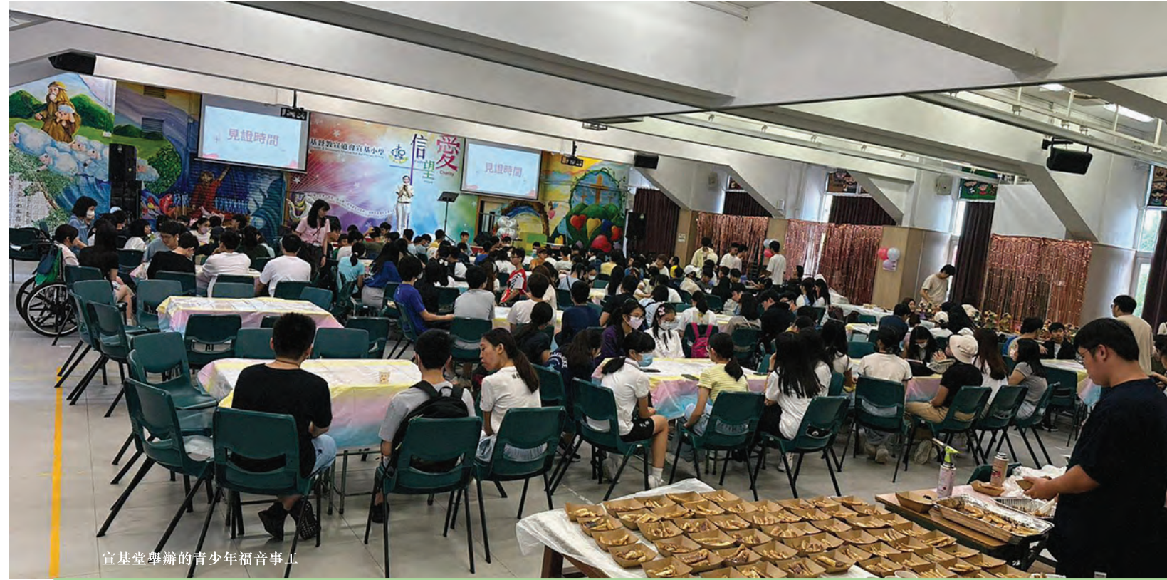
宣基堂舉辦的青少年福音事工