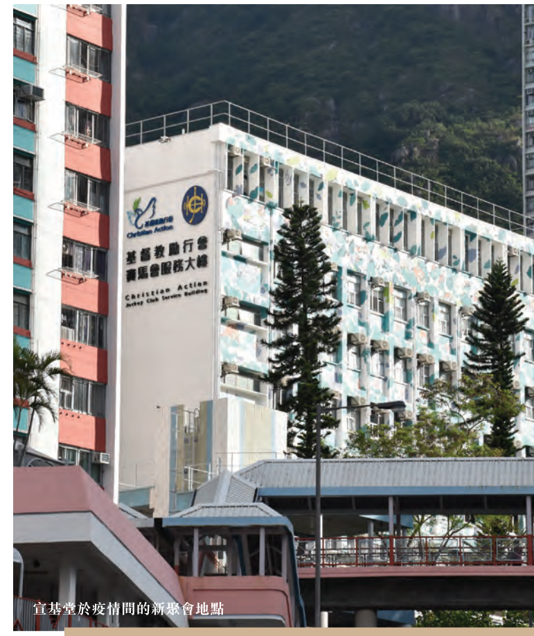
宣基堂於疫情間的新聚會地點