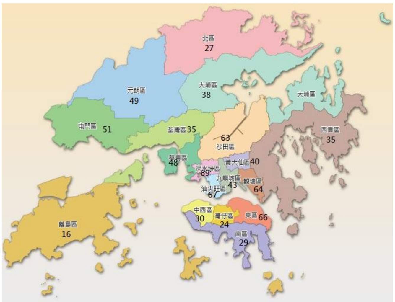
圖一：按區議會分區劃分的香港首二十大宗派堂會數目

5. 表一顯示，在全港共約 1,300 間的華人教會中，在首二十大宗派名下的堂會數目共 794 間，即超過六成。當中，逾四成半的堂會在新界；逾三成半在九龍；而不足兩成在香港島。相對而言，全港人口逾五成在新界；三成在九龍；而不足兩成在香港島。（亦請參圖一）