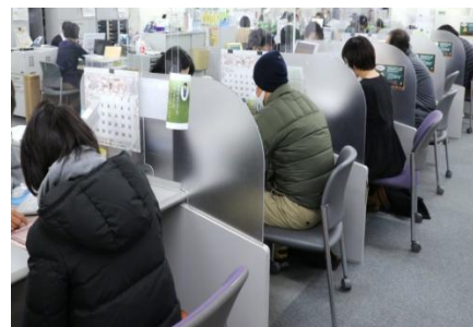
疫情下失業者尋求工作的情況

日本的新型肺炎疫情爆發至今已超過一年，最近有一項電話調查顯示，有 65.2% 的受訪者在疫情後感到不同程度的生活困苦。另外有機構進行調查發現在疫情下，靠兼職收入為生的人士當中，有 146 萬人（女性 103 萬人、男性 43 萬人）的工作量大減，只能維持以前的一半以下，他們並未接受任何經濟援助，而完全失業人士就有 197 萬人，營商被迫休業的人士有 244 萬人。而日本政府剛發表了 2020 年的自殺人數數字，為 2 萬 1 千零 81 人，比起前年增加了 4.5%，而女性自殺者的增長率是 15.4%，這增長無疑是一個很高的數字，衛生勞工署表示受到疫情影響，市民留在家中的時間大增，造成與家人相處不和及感到壓力的個案增多，另外因工作情況惡化導致生活貧困的人數也大增，這種種因素也令自殺人數上升。