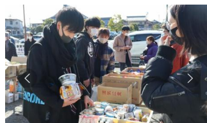
市民發起提供食物給困苦大學生