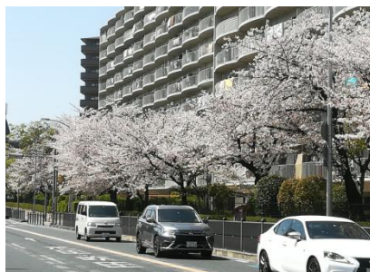
日本每年四月頭櫻花盛放