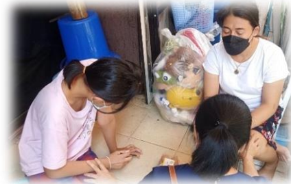
泰人同工在復活節積極出外探訪及傳福音