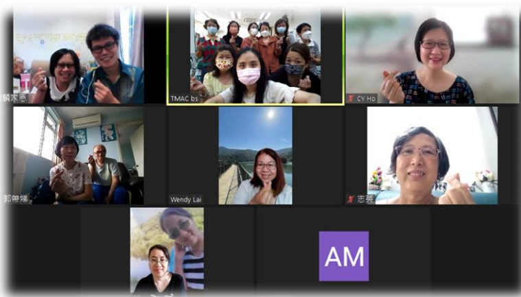
宣道會屯門堂週一差傳祈禱會分享及兒童崇拜帶領聚會