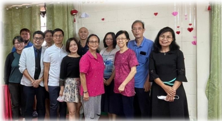
歡送一對夫婦移民到英國