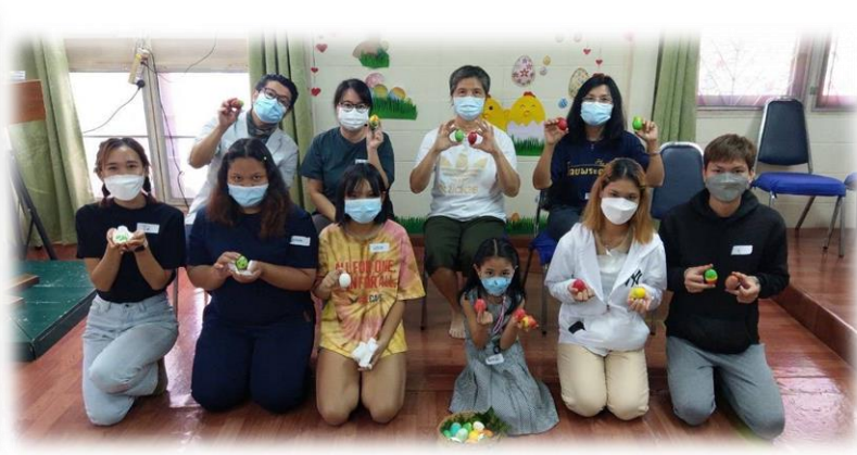
同工們舉辦復活節慶祝活動