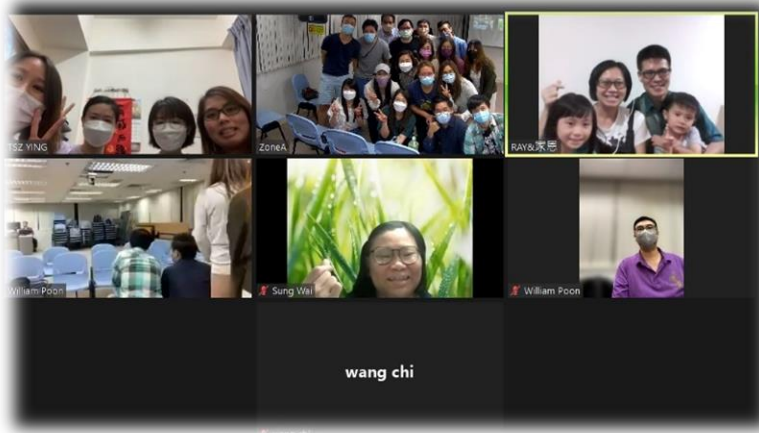
鼓勵昔日曾牧養的年青人