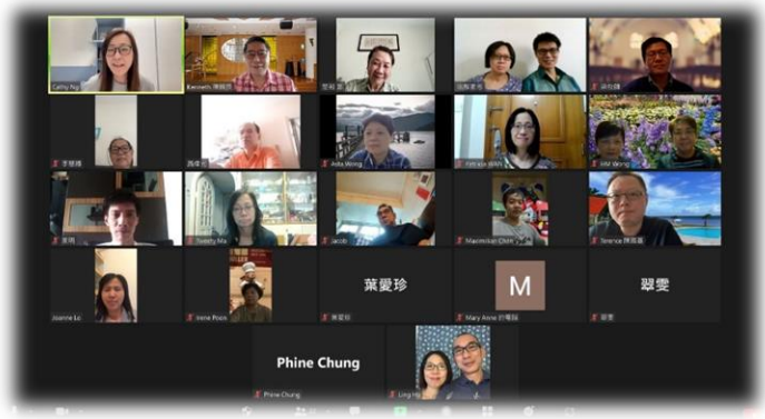
與宣道會茵怡堂弟兄姊妹相聚分享