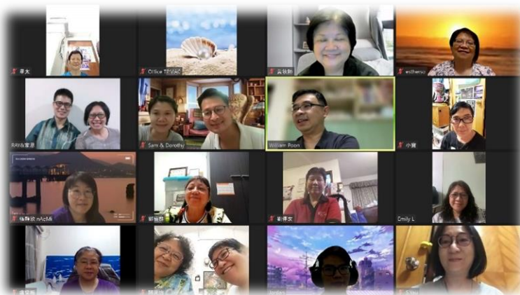
得到母會(宣道會大埔堂)眾肢體的祈禱及加力