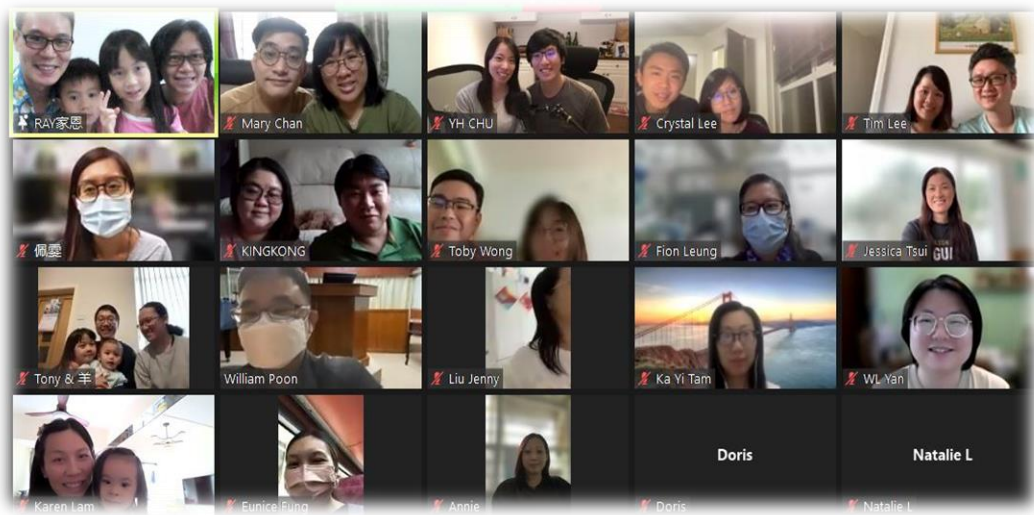
享受與我們熟悉的團契分享 (來自 4 地：英、加、泰、港)

5 年的日子中發生的事情實在太多，過去香港社會面對疫情及社運動盪，我們相熟的朋友大都移民，未能與他們好好相聚及送別，香港教會多番的人事變動等，有種無形的慨嘆，加上早前家恩爸爸的身體，激發我們更想回港探望家人，好好與他們見見面及大吃大玩一餐，關心他們.....這種感受讓我們想起昔日宣教士幾年後回鄉所面對的感受：變遷的社會景象與步伐、又熟悉又陌生的面孔、支持者的減少等，那種複雜的情緒是宣教士需要調節及面對的，幸好現在資訊科技發達，雖不能實體相見，也可隨時方便聯絡，期待明年暑假能順利回港吧！雖然未能回港，幸好今次的「另類述職」，可以讓我們夫婦二人各自到酒店退修 5 日，稍作休息安靜，重整自己身心靈、被神的說話醫治、調整及計劃將來事奉方向。事實上，在工場的事奉實在太忙碌，加上人手支援太少，停下來卻無人頂替，有時連放假都感到奢侈，難怪宣教士是一個容易令人 Burn out 的工作，感謝神在我們「述職」期間，有其他宣教同工暫時頂替我們日常堂會的工作，以致我們能專心好好的述職。