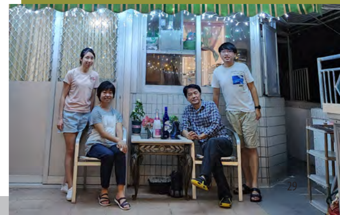
蘇師傅一家（攝於 2022 年中秋節）

感謝主，為建道神學院預備了這一位好同工，他多年來的忠心服侍是眾多不同年代的建道人所能證實的。深願上主賜福他和她一家。