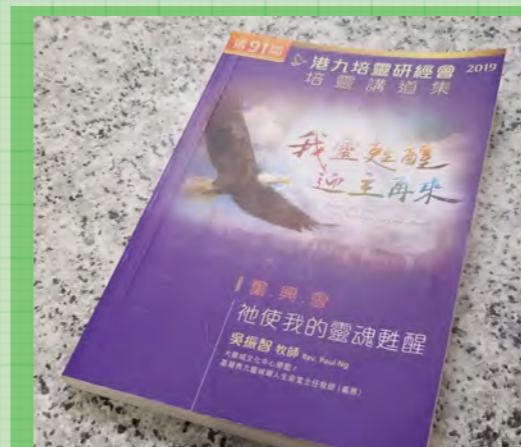
2019年港九培靈研經會奮興會主題 祂使我的靈魂甦醒

會後和妻子分享，說到神呼召我全時間事奉祂，我準備離開廿多年的教學生涯，心中「猶有餘悸」，但妻子回應：「你不踏出去又怎看到紅海分開」？於是，2019年，我重新開始停止了14年的團契生活，認真查考聖經和參與事奉，甚有「被擄歸回」的感覺。離開舊教會及一切事奉，人生好像在荒廢的耶路撒冷，但奇妙地，神讓團契查考以重建城牆和屬靈生命為主題的《尼希米記》，「來罷，我們重建耶路撒冷的城牆，免得再受凌辱！」（尼 2:17下）給我適切的亮光。這世代撕裂離散、戰亂疫病，末日感籠罩下，信、望、愛也像隨流失去。基督僕人更要接受整全裝備，回應時代挑戰，見證福音大能。有次和妻兒一起禱告，年過半百的我問神，在這地自己還可以做甚麼？說到我不想再浪費餘生時，忍不住流下淚，那刻兒子竟然主動給我擁抱（從未試過），當下我流淚感恩，妻子讚美神說：「我們怎能不事奉主？」。「至於我和我家，我們必定事奉耶和華。」（書 24:15下）這正是神賜我家的恩典！