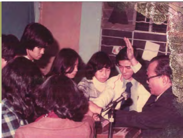
蘇師傅（右二）與他口中的老牧師（右一）團契按立（攝於 1981 年）

「回想從前返教會，老牧師常常在崇拜結束前，向會眾發出呼召，呼召會眾奉獻自己、讀神學。當時，有不少兄弟興起回應呼召，但我自知不是讀神學的材料，心中總有少許歉疚，只得低頭埋首，期望『呼召』快點過去。『建道請人』的消息提醒我，可以有另一種方式回應神的呼召。」