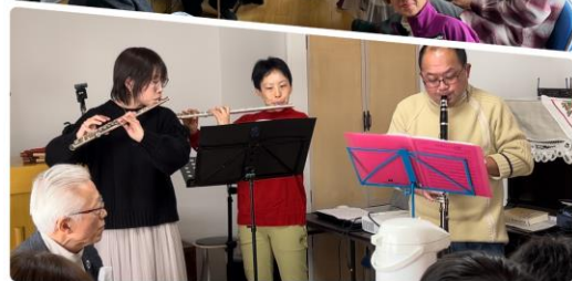
Christmas Eve 崇拜