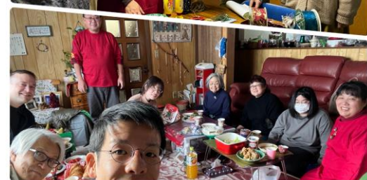
朝日家庭聚會+Joyful Ladies 聚會