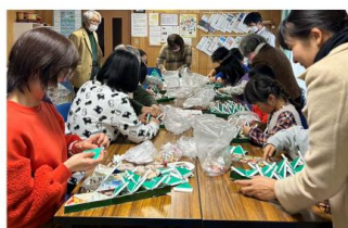
Advent Calendar 佈道活動