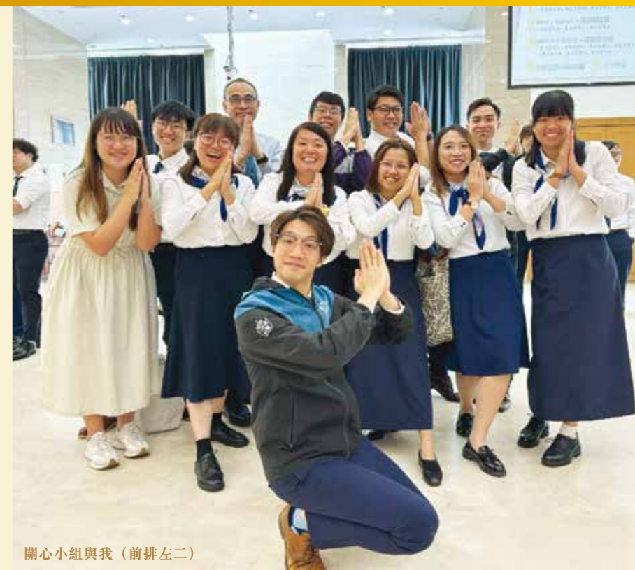
關心小組與我（前排左二）

回顧這四年的神學旅程，我完成了很多功課，學習與書本成為朋友，努力按時完成。四年過去，我的前額上也增添了一撮白頭髮，成為這趟旅程