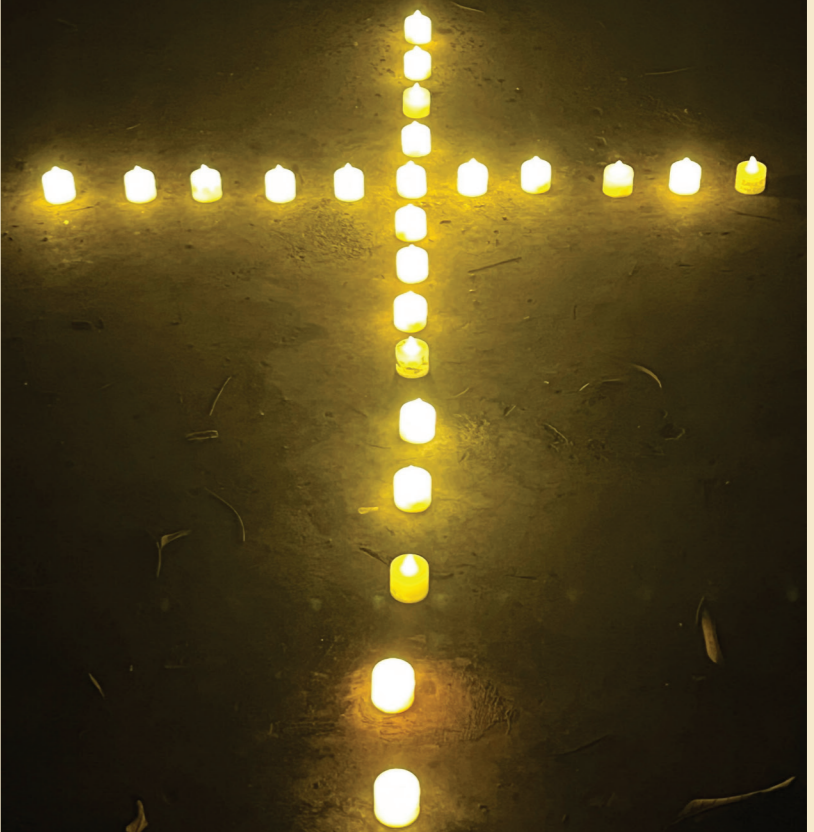
畢業營會中的十字架，Light of the World！

感謝主，常與我同在！感謝太太，常肯定和鼓勵我！感謝同學們和守望者，常支持我，並為我的生命禱告！願榮耀歸主！