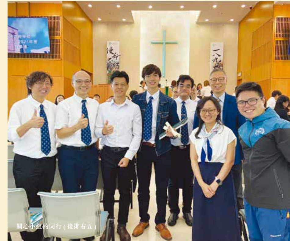
關心小組的同行（後排右五）

生命就是經歷高低起跌，旅途雖不似預期，卻是滿有驚喜！感恩天父總是捉緊我不放手！無盡感恩歸我父神！堅信下一站會更加精彩，願堅守真光，以使命前行，繼續察看天父如何著緊我和我家，以及如何著緊大家！