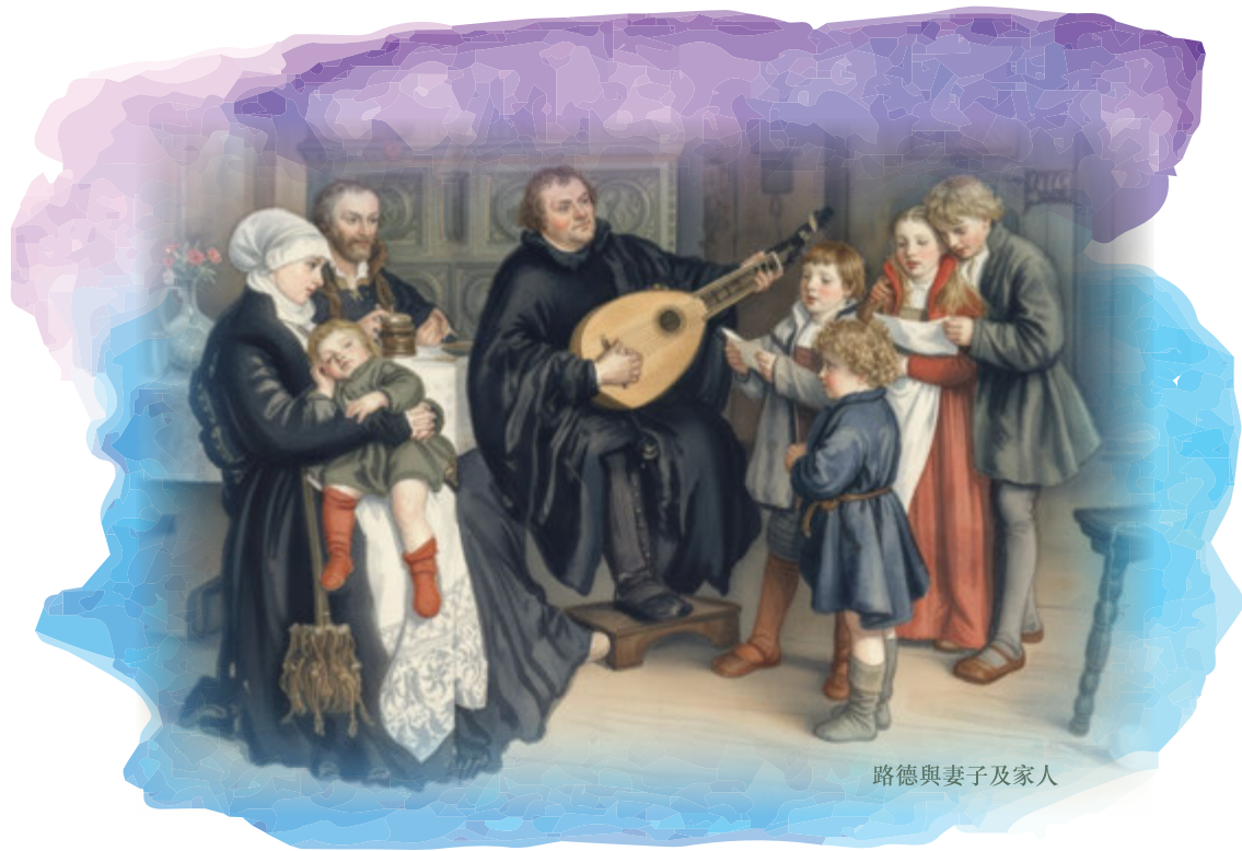
路德與妻子及家人