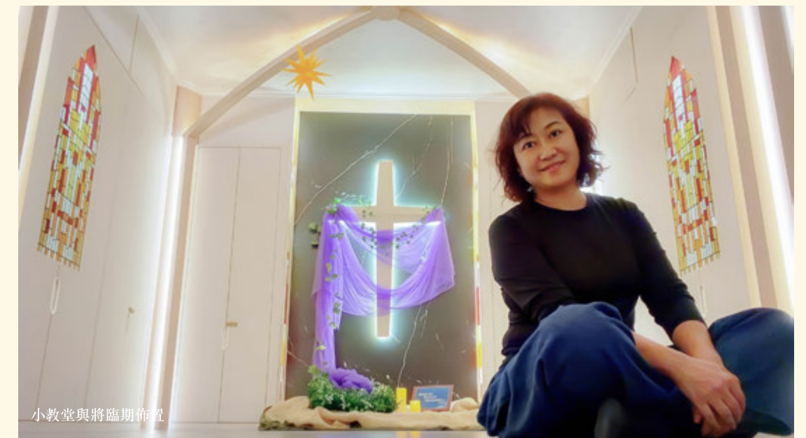
小教堂與將臨期佈置