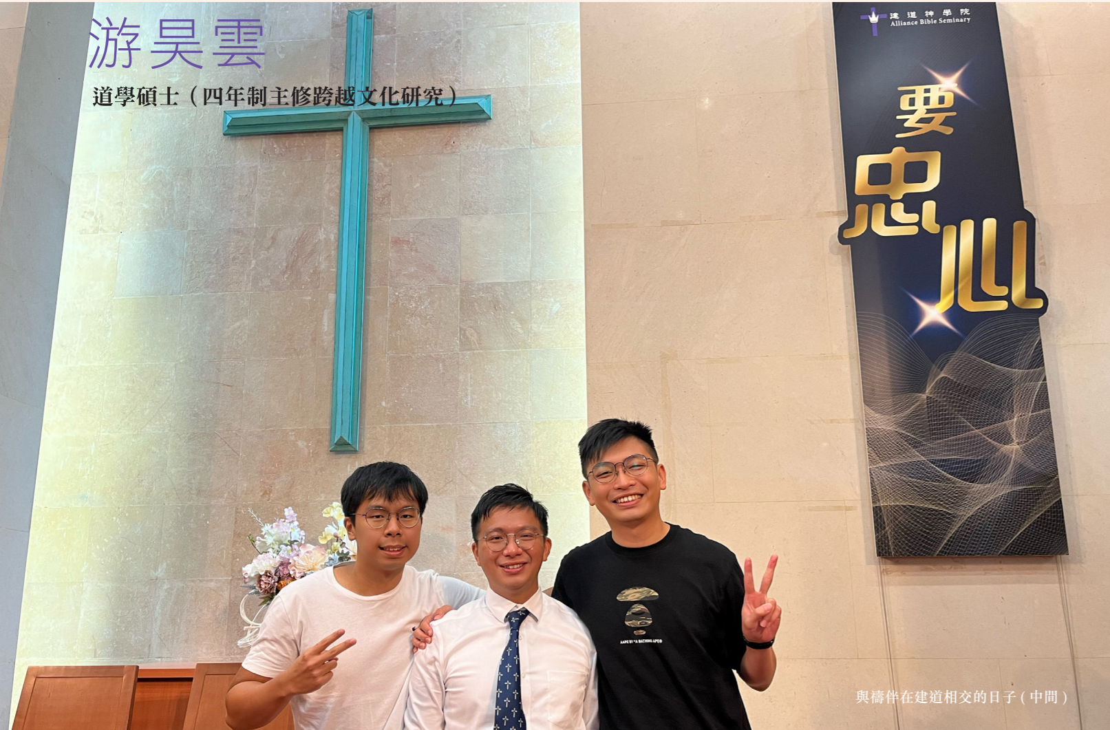
與禱伴在建道相交的日子（中間）

回顧四年的建道學習，我看這是認清召命的過程。記得初入建道時，我很想探索自己可以如何委身參與創啟地區的宣教，所以入讀了道學碩士（四年制主修跨越文化研究）課程。在這四年裏，我深感上帝一步步帶領我擴闊眼界，讓我看見各種事奉的可能性。