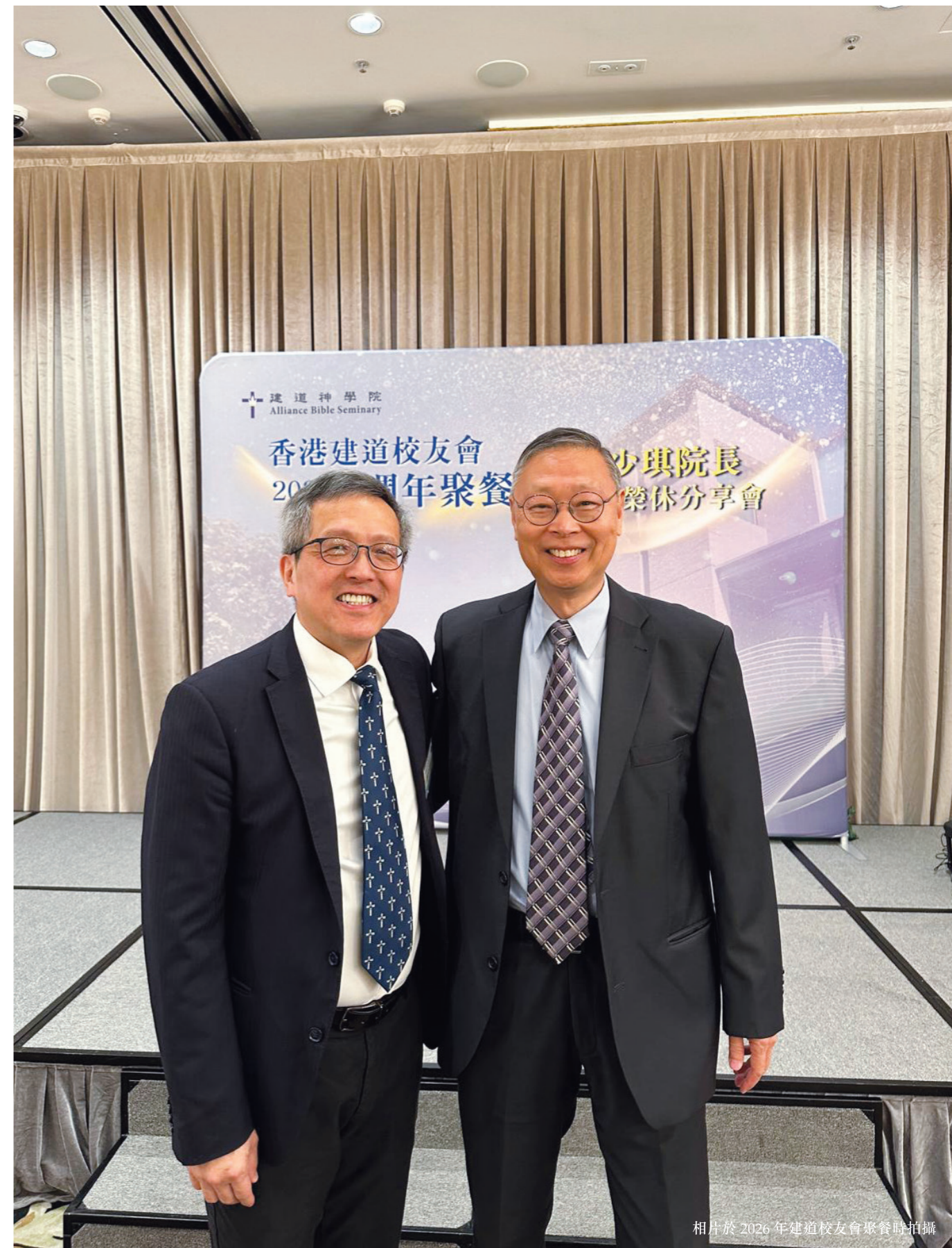
相片於2026年建道校友會聚餐時拍攝