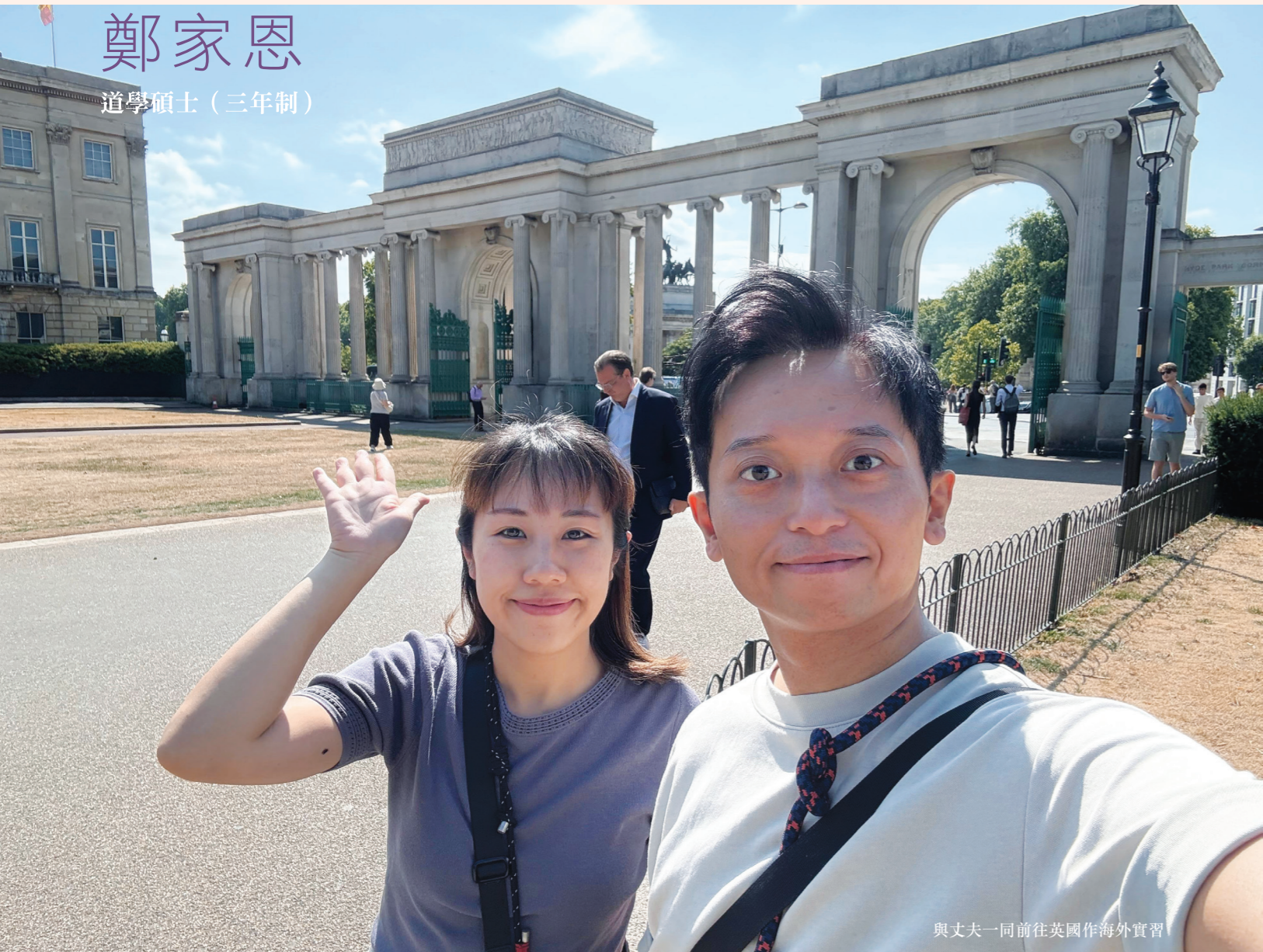
與丈夫一同前往英國作海外實習

不經不覺，三年道學碩士之旅已緩緩地走到尾聲，這也為我刻劃出既深刻又具意義的靈命旅途，旅途上曾走過高山與低谷，在蜿蜒曲折的山路上遠望，向前看——祢在；向後看——祢都在。