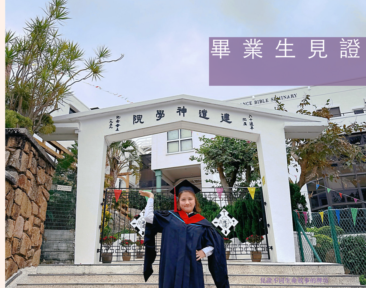
見證不同生命故事的牌坊

更令我驚訝的是，我發現同屆同學中竟然有近一半的同學具備媒體相關背景，他們有的來自初創公司、有的從事平面設計、有的精通網絡營播。這讓我看見一個清晰的異象：新一代的牧者正被賦予一項共同的時代技能：媒體。我們討論的牧養不再侷限於實體的探訪與講道，更延展至「網絡牧養」，甚至是「混合牧養」的模式。神透過這群同路人讓我明白我的專業並非神學路上的支流，而是回應這個時代不可或缺的器皿。