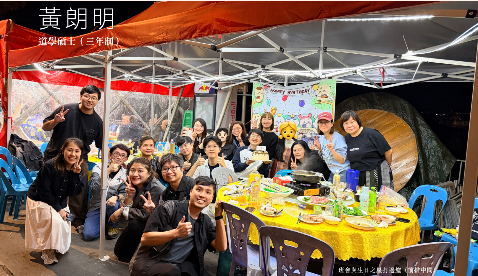
班會與生日之星打邊爐（前排中間）

對於一個從不喜歡讀書，也不擅長讀書的我來說，在聽到上帝的呼召之前，實在是未曾想過要在大學畢業後繼續讀書，遑論要放棄一份穩定，而且自己表現如魚得水的工作，繼而重新規劃和部署自己的人生方向，進入神學院這個自己陌生的領域，焚膏繼晷地重新學習。