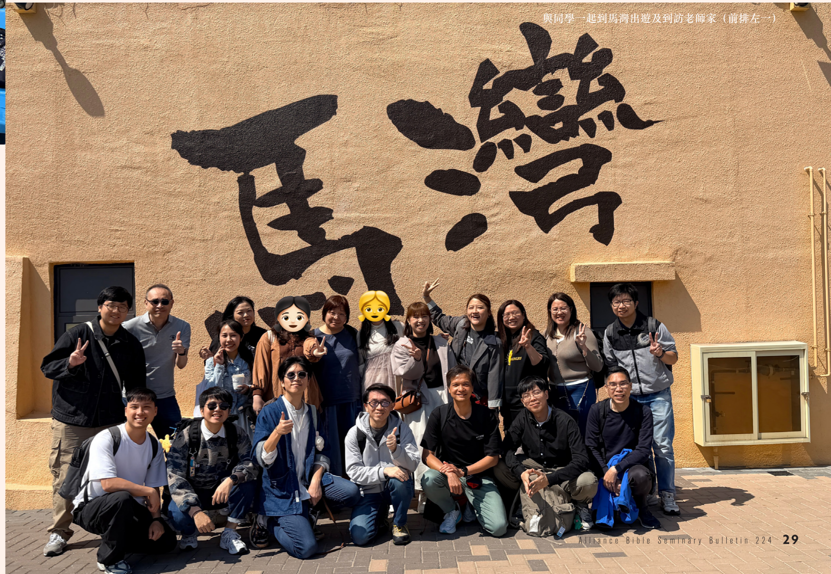
與同學一起到馬灣出遊及到訪老師家（前排左一）

感謝神讓我明白到事奉的道路並不是獨自升級，更不是要與同行的人爭競，而是互相配合、互相提醒、互相勉勵。我能順利畢業而且認識到一班事奉道路上的同行者，全是恩典，願榮歸我主。 ■