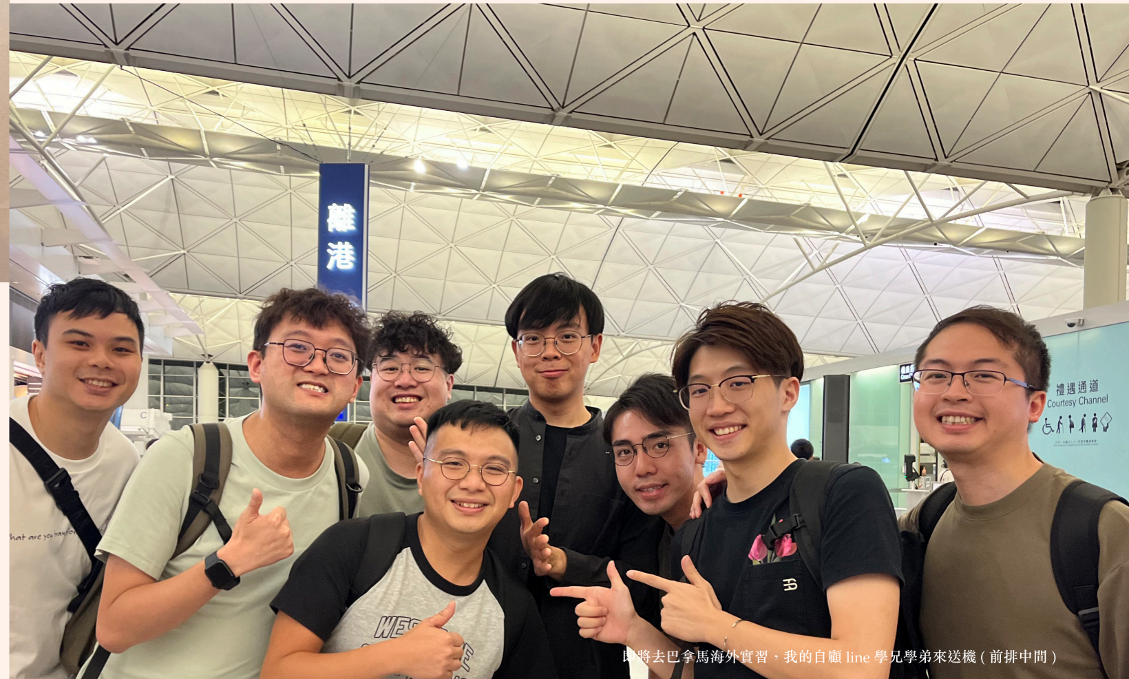
即將去巴拿馬海外實習，我的自願 line 學兄學弟來送機（前排中間）