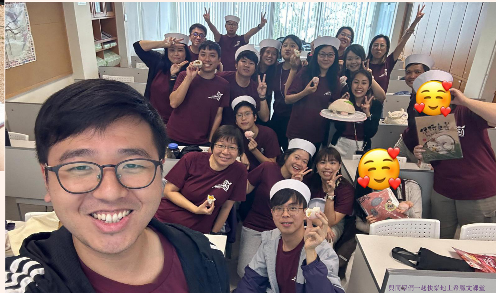
與同學們一起快樂地上希臘文課堂

最後，感謝這段神學路上，一直默默支持我的丈夫、家人！願榮耀、頌讚歸於聖父、聖子、聖靈三一真神。阿們！